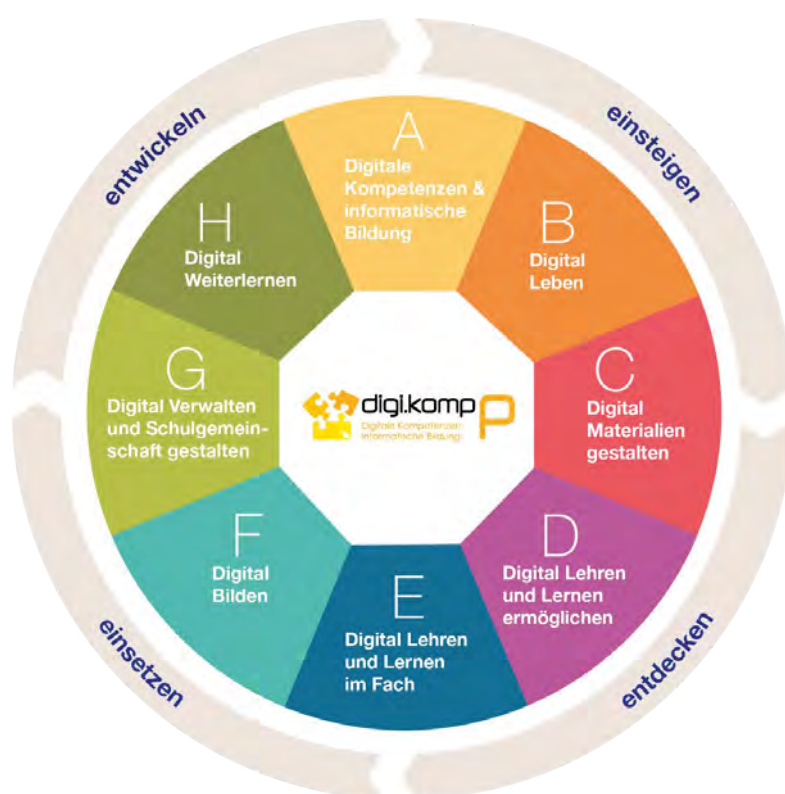
Abb. 2: digi.kompP. Grafik: Onlinecampus Virtuelle PH im Auftrag des BMBWF; Version 2.0

Versucht man die benötigten Kompetenzen für das Distance Learning aus dem Kompetenzkatalog digi.kompP zu extrahieren, so wird ersichtlich, dass für die erfolgreiche Planung und Durchführung von Distance Learning Kompetenzen aus allen acht Bereichen vonnöten sind. Manche können kurzfristig erworben werden, viele dieser Kompetenzen müssen aber bereits im Vorfeld des Notfall-Homeschoolings angeeignet worden sein (siehe die Ergebnisse der Studien in Abschnitt 3). Lehrende müssen neben den Grundkenntnissen im Umgang mit digitalen Medien (Kategorie A) vor allem das digitale Gestalten von Materialien (Kategorie B), das digitale Lehren und Lernen (Kategorie C – beispielsweise die Nutzung von Lernplattformen, Kommunikations- und Kollaborationstools), das digitale Lehren und Lernen im Fach (Kategorie E, z. B. die Nutzung fachspezifischer