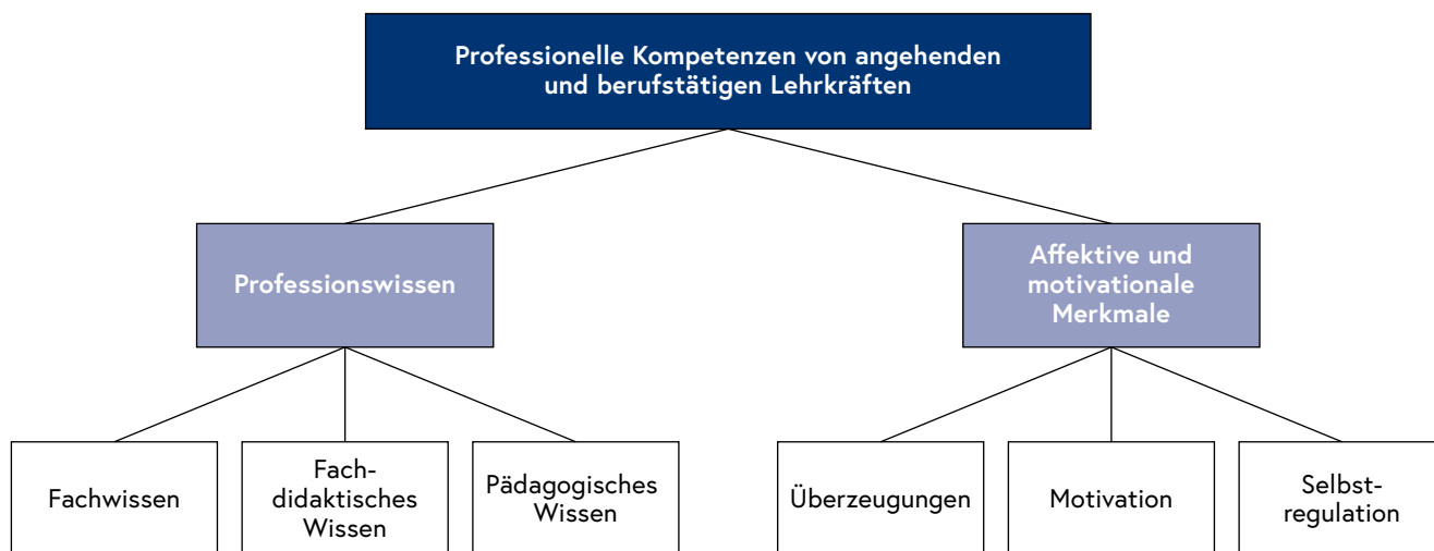
Abb. 3: Professionelle Kompetenzen (Herzmann und König, 2016, S. 111)

Im kompetenztheoretischen Ansatz der Lehrerforschung, der v. a. bildungswissenschaftlich geprägt ist, werden die Kompetenzen von Lehrerinnen und Lehrern als „erlernbare kognitive Fähig- und Fertigkeiten, die zur Lösung bestimmter Probleme und Aufgaben nötig sind“, betrachtet (Herzmann & König, 2016, S. 108). Diese können durch Aus-, Fort- und Weiterbildung erweitert werden. Der Expertise-Ansatz nimmt an, dass die Tätigkeit von Lehrerinnen und Lehrern durch ihr Wissen und Können geprägt wird, welches in der Ausbildung und in der Praxis erworben und erweitert wird. 22 Beide Aspekte werden im Folgenden berücksichtigt.