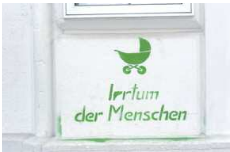
Graffiti auf der Fassade einer Volksschule

Die Gebäudeverwaltung der Stadt Wien reagierte auf die notwendige Anzeige wegen Sachbeschädigung typisch und atypisch österreichisch: Die „Beschriftung“ wurde am folgenden Tag reinweiß übermalt. Jedoch nicht besonders sorgfältig: Ein kleiner grüner Sprüherand ist immer noch sichtbar.